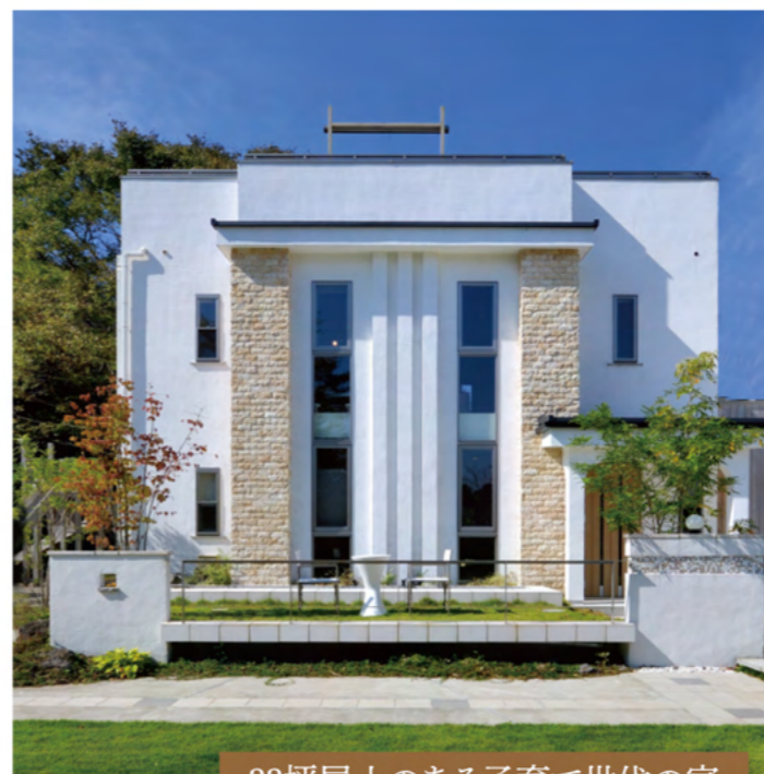
33坪屋上のある子育て世代の家