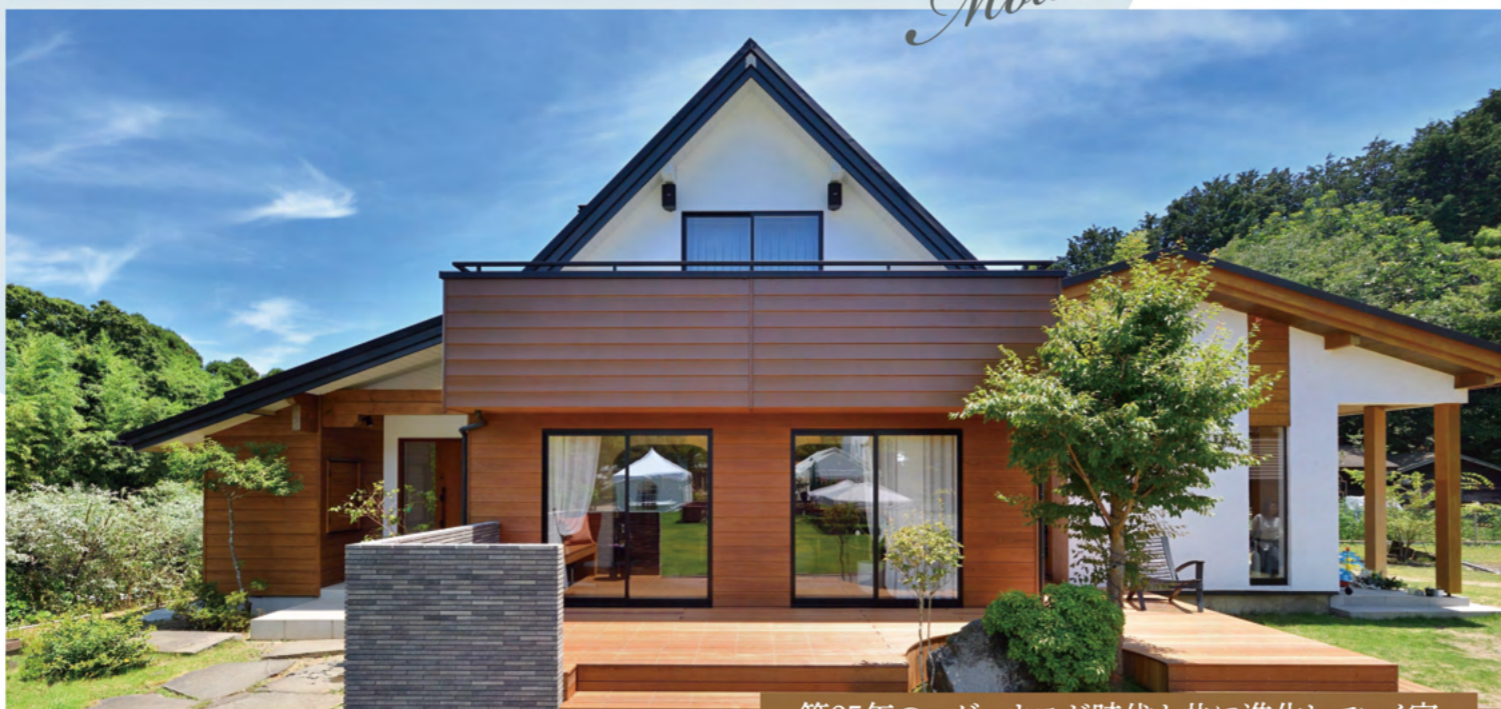
築25年のログハウスが時代と共に進化していく家