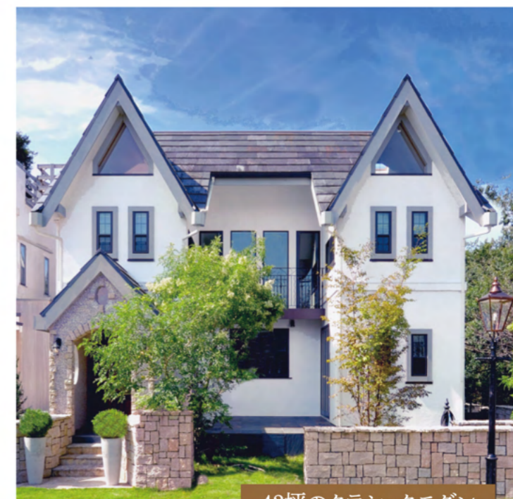
42坪のクラシックモダン