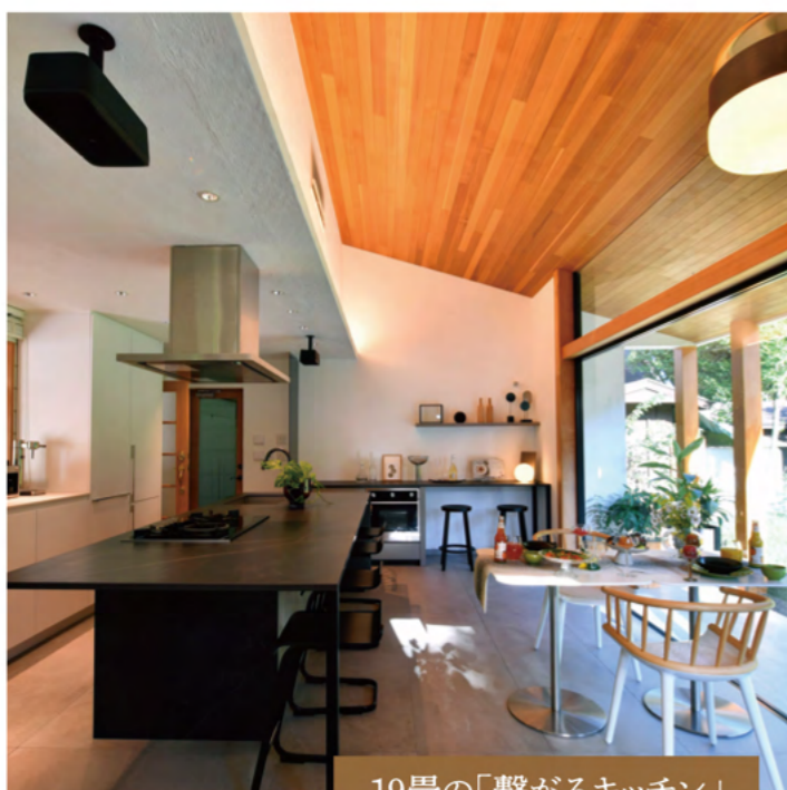
19畳の「繋がるキッチン」