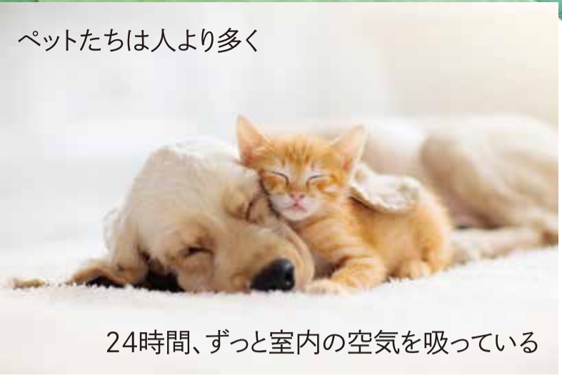
ペットたちは人より多く