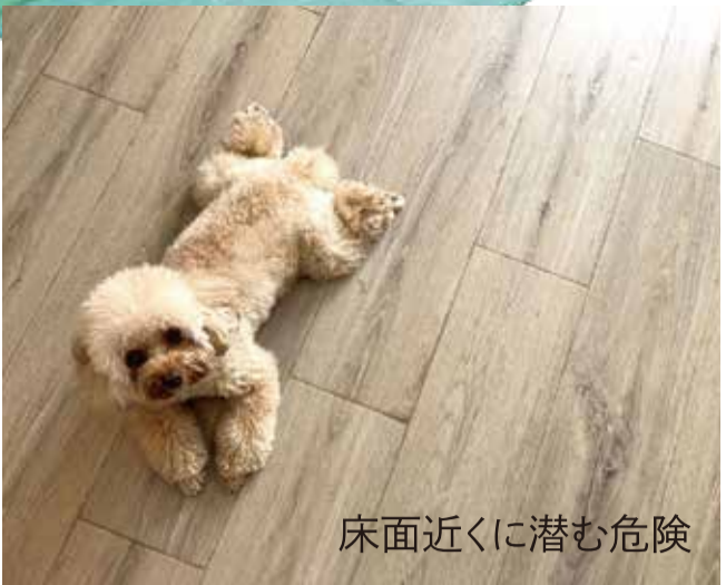
床面近くに潜む危険

ほこりが床にたまるように、化学物質は床面近くに滞留します。赤ちゃんやペットは有害な化学物質を小さな体に大人より多く吸い込んでしまいます。病気やアレルギーの原因になることだけでなく、細胞レベルへの悪影響の可能性も。