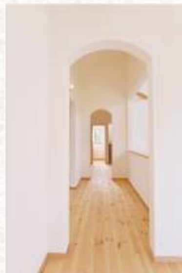
2階の廊下は続けるのWアーチ。サイドの腰壁越しに御柱を臨めます。吹き抜けから朝日が降り注ぐ時間帯はよりパワフル！