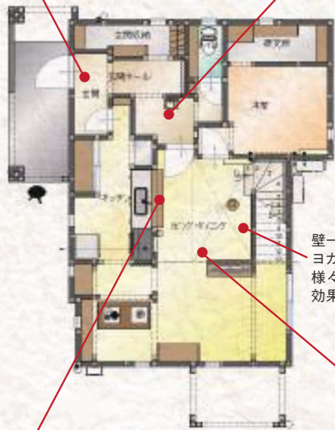
壁一面に1枚モノの大型鏡を設置。ヨガやダンス、筋トレなど…用途は様々。空間を広々と見せてくれる効果も◎