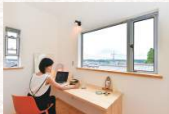
窓からの眺めが最高なお仕事ルーム。吹き抜けもそのまま残した開放感な空間と絶景を前にアイデアも膨らみ作業も捗りそう！