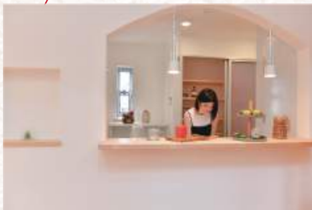
ペンダントライトとアーチで魅せるカウンターキッチン。タカラスタンダードのホーローシステムキッチンや地震の時も安心な作り付けの食器棚で機能面もバッチリ！