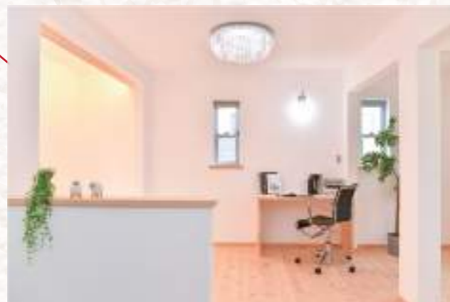
シャンデリアや間接照明を備えたほどよい広さでゆったりくつろげるリビング。一角にある机は、オープンベースで勉強や作業をしたときにもぴったり。